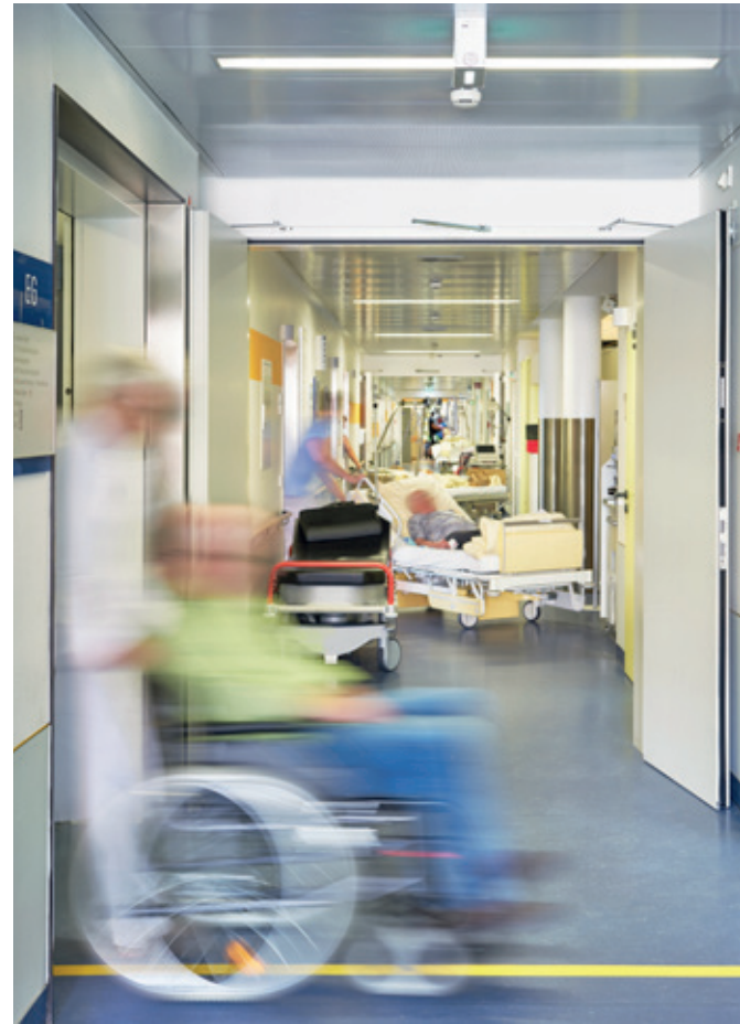
Beschäftigte in der Pflege arbeiten oft am Limit.

Gute Pflege erfordert qualifiziertes Personal – und dieses braucht wiederum Zeit für den „Faktor Mensch“