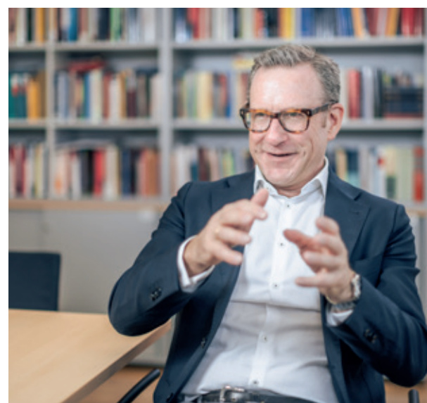
Der 56-jährige Wiener ist ein profilierter Arbeits- und Sozialrechtsexperte mit langjähriger Erfahrung auch in europäischen Fachgremien.

Menschen arbeiten, weil sie etwas bewirken wollen. Arbeitsplätze sollen Sicherheit bieten und zugleich Entwicklung ermöglichen. Arbeit darf nicht ausbeuten, sondern soll befähigen.“