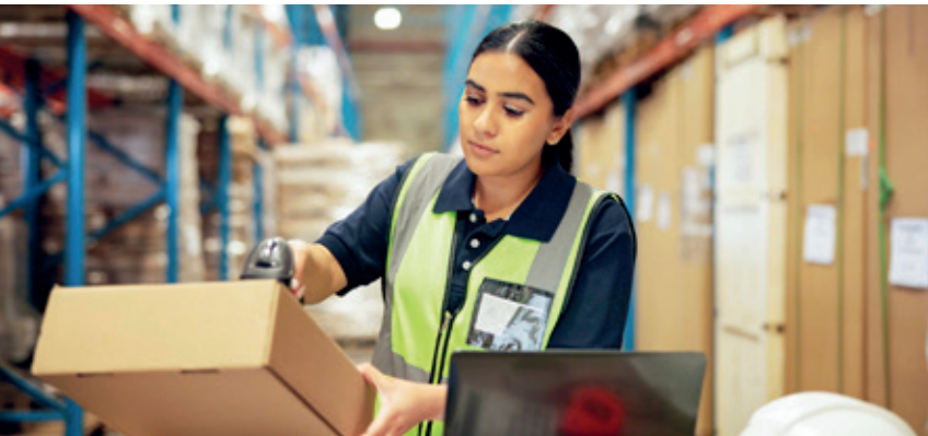
Die Anweisungen kommen vom Display.

Der Scanner piept. 23 Sekunden für das nächste Paket. Jeder Arbeitsschritt vorgegeben, jede Bewegung erfasst, alles in Echtzeit. Wer langsam ist, rutscht im Ranking ab. Ein Gespräch mit dem Chef? Kaum. Die Vorgaben kommen vom System.