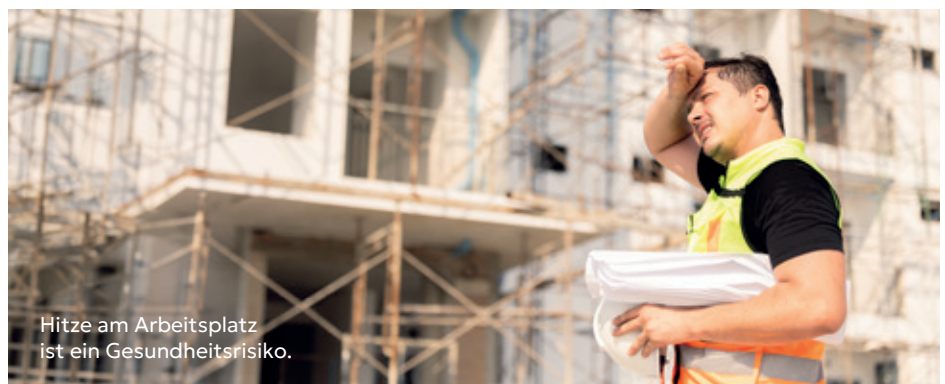
Hitze am Arbeitsplatz ist ein Gesundheitsrisiko.

Der AUVA-Blog bietet spannende Infos rund um den Hitzeschutz.