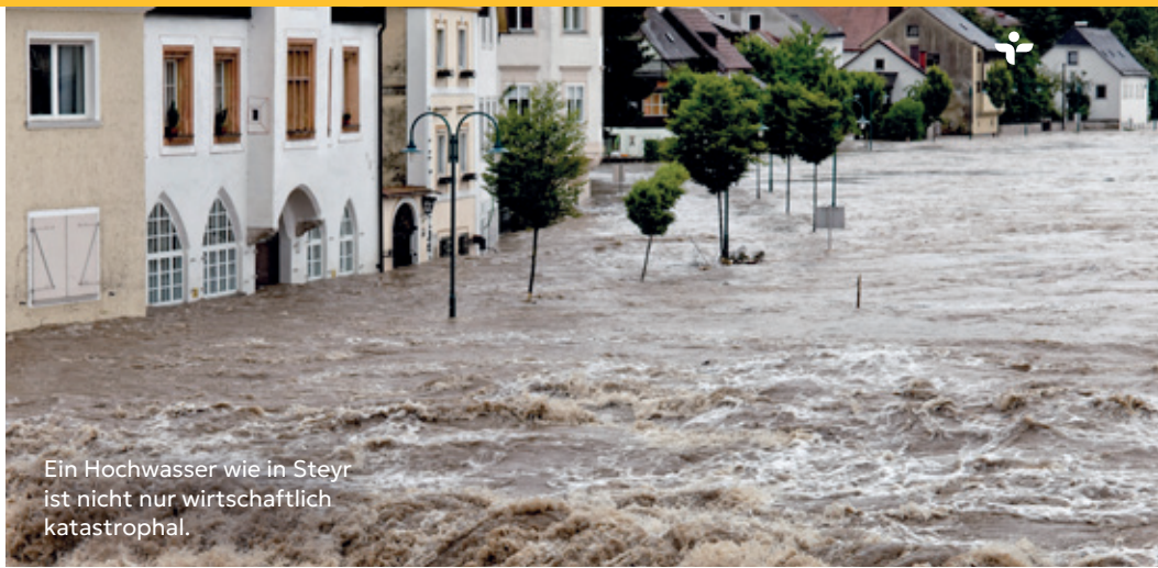
Ein Hochwasser wie in Steyr ist nicht nur wirtschaftlich katastrophal.

Extremwetter, Hitze und Zukunftsängste belasten zunehmend die psychische Gesundheit – und werden damit zu einem wachsenden Risiko für Beschäftigte.