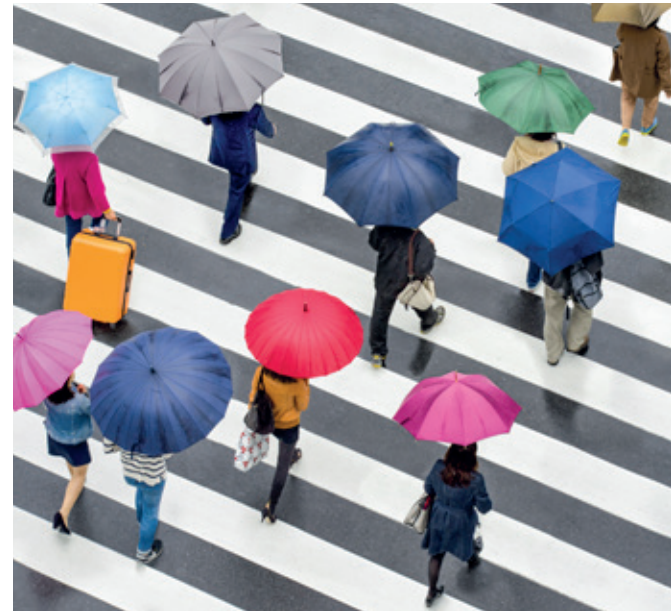
„Gute Bürokratie“ ist ein wirksamer Schutzschirm für die vielen Arbeitnehmer:innen.

Gerade der Bereich des Brandschutzes macht greifbar, worum es geht. Ein wirksames Brandschutzsystem im Betrieb ist zwangsläufig „bürokratisch“: Gut beschilderte, freie Fluchtwege, regelmäßige Prüfungen und Wartungen von Feuerlöschern und Anlagen, Brandschutzübungen oder Schulungen von Beschäftigten. Wird argumentiert, man müsse „nicht jede Kleinigkeit dokumentieren“ oder „den Betrieben mehr Eigenverantwortung lassen“ und werden in der Folge Schutzvorgaben aufgeweicht, entstehen Lücken, die im Ernstfall tödlich sein können: Genau das, was zuvor als „Papierkram“ abgetan wurde, entscheidet dann