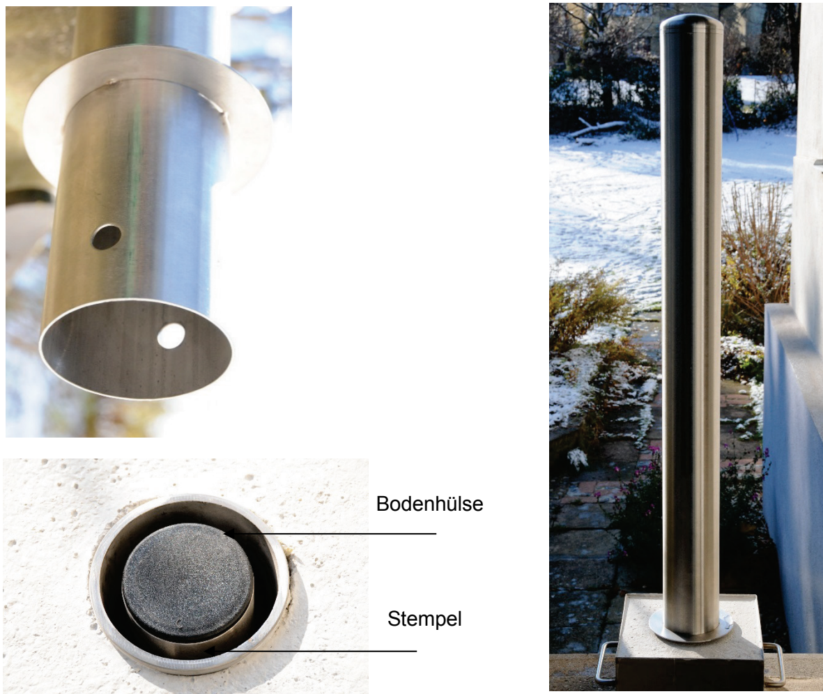
Abbildung 2 - 4: Musterpoller aus Metall