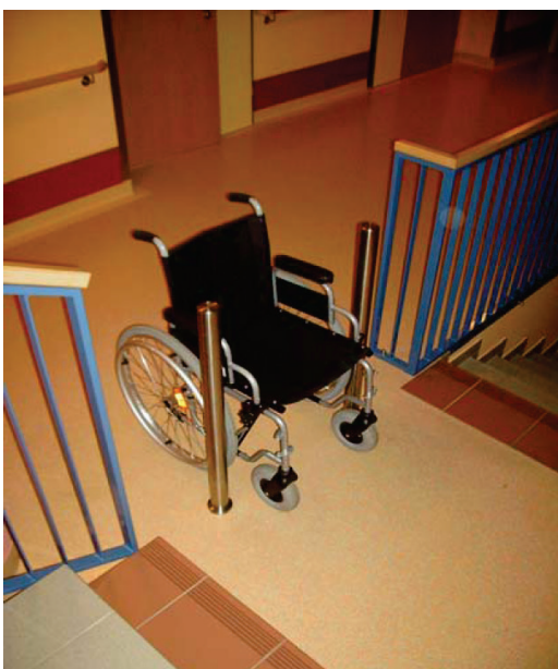
Abbildung 1: Poller als Absturzsicherung.

In den „Technischen Grundlagen für die Beurteilung von Pflegeheimen“ des Landes Steiermark sind für Treppenabgänge, deren Antrittsbereich mit Rollstühlen oder Gehhilfen befahren werden können, Poller als Absturzsicherung empfohlen.